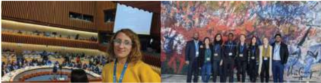
مراقبو منظمة الصحة العالمية و بي ايتش ايم، جين لاسي نيكولز في اجتماع المجلس التنفيذي لمنظمة الصحة العالمية ، يناير 2021 يناير 2020