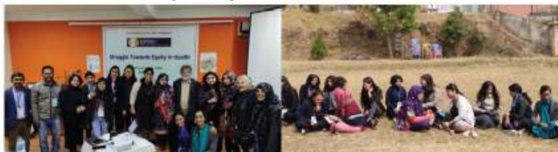
مناقشة حول الجنس والصحة العقلية كجزء من جامعة صحة الشعوب الدولية (آي بي ايتش يو) في منطقة جنوب آسيا 2020 في كاتماندو نيبال

تم تنظيم الجامعة الدولية لصحة الشعوب (آي بي ايتش يو) في منطقة جنوب آسيا بالاشتراك مع ساما و بي ايتش ايم في فبراير 2020 في كاتماندو (نيبال). كان الهدف من آي بي ايتش يو هو بناء قدرات المهنيين الصحيين الشباب والعمال الاجتماعيين والباحثين والناشطين. وشاركت في المؤتمر ست دول من جنوب آسيا. وتضمنت محتوى ومناقشات آي بي ايتش يو مفاهيم الإنصاف والصحة والمحددات الاجتماعية ؛ الاقتصاد السياسي للصحة ، وفهم النظم الصحية وانتقالها ، وتأثير التجارة على الصحة ، والقضايا المتعلقة بالحصول على الأدوية ، وما إلى ذلك.