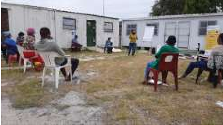
تدريب مجتمعي حول فيروس كورونا 19 للنشطاء - بي ايتش ايم جنوب أفريقيا