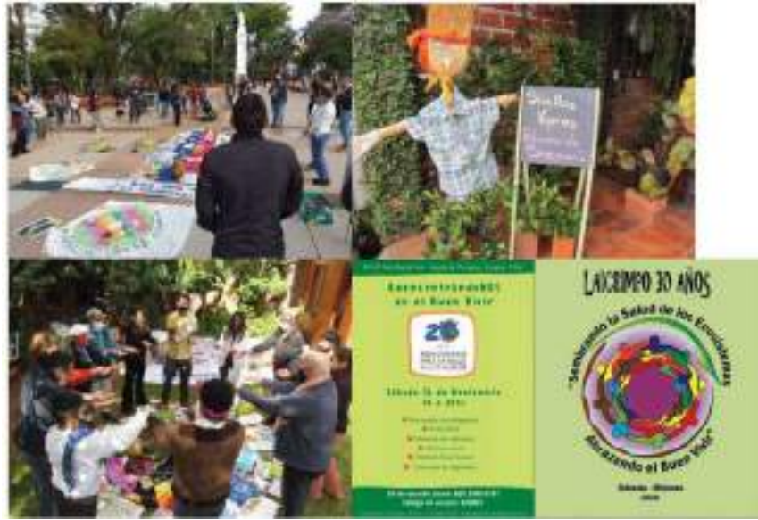
نكرى سنة الثلاثين لحركة لايكريمبو في الأرجنتين

شكلت وحدة الأرجنتين لجان دعم النظام الصحي للمتابعة الهاتفية للأشخاص المصابين بفيروس كورونا وعائلاتهم. أعدت مقالات وكتيبات وتمهيديات لنشرها في سياق الجائحة (جريلا الحمراء ولايكريمبو). كما هي نظمت برامج إذاعية تربط 22 محطة بمعلومات محدثة عن كوفيد 19 ("ديشوجاندو لا مانزانيا")