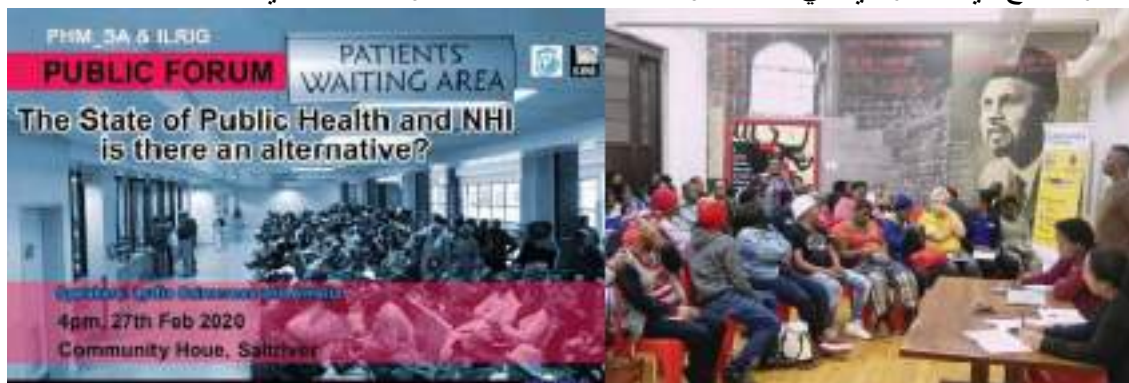
اجتماع عام في جنوب إفريقيا - "حالة الصحة العامة و اين ايتش آي : هل هناك بديل؟".