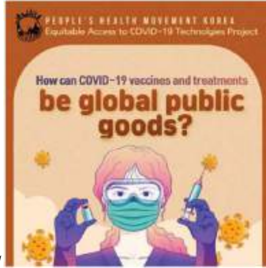
الرسوم البيانية من إعداد بي ايتش آي كوريا الجنوبية