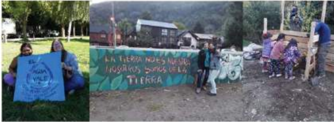
صور من معرض حول صناعة السماد مع مجموعة جاريليا في سان أندريس دي لوس أنديس بالأرجنتين

ونتيجة للتدابير وما حدث في مواجهة الوباء ، انضمامنا إلى مبادرة تكوين الميثاق الوطني للحياة والصحة الذي أدى إلى سلسلة من المطالب والتحديات وأعمال المناصرة السياسية لحق الصحة في خلال النصف الثاني من عام 2020.